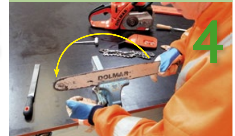
Draai de geleider in de bankschroef De braam aan de achterzijde van de geleider is nog niet weggevijsd. Draai de geleider in de bankschroef, zodat de achterkant voor komt en u deze kunt vijlen.