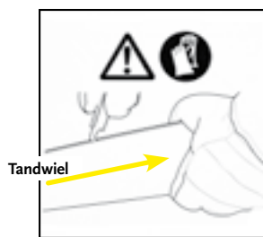
Bron: Dolmar PS 5000

steller wordt gebruikt. De geleiders zijn in de fabriek iets gehard, waardoor deze kleine vijltjes bot worden. Een grote zoete vijl werkt het best. Op foto's 1 tot en met 6 laat Fiedeldij Dop van De Groene Praktijk zien hoe u in twee minuten de braam van de geleider vijlt. Monteer de geleider na elke schoonmaakbeurt telkens omgedraaid. De merknaam staat dan op zijn kop. Zo slijt de geleider gelijkmatig aan de onder- en bovenkant. Wanneer een goed geslepen ketting moeilijk grip op het hout krijgt en na grote druk in één keer wel zaagt, is de geleider versleten. Vooral als het dwars op het hout zagen nog wel gaat en het schuin zagen (bijvoorbeeld het dak van de kerf) onder 45° echt niet wil, dan is dat een indicatie dat de geleider versleten is. ■