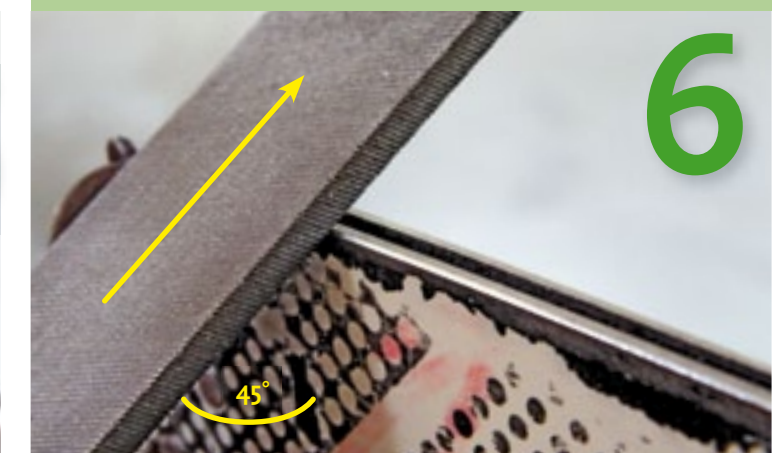
Achterste braam wegvijsen onder 45° Vijl wederom onder 45° totdat er een schuin vlak van 1 mm op de zijkant van de geleider te zien is. De bovenkant van de geleider is nu klaar. Draai de geleider om en vijl nu de onderkant van de geleider.