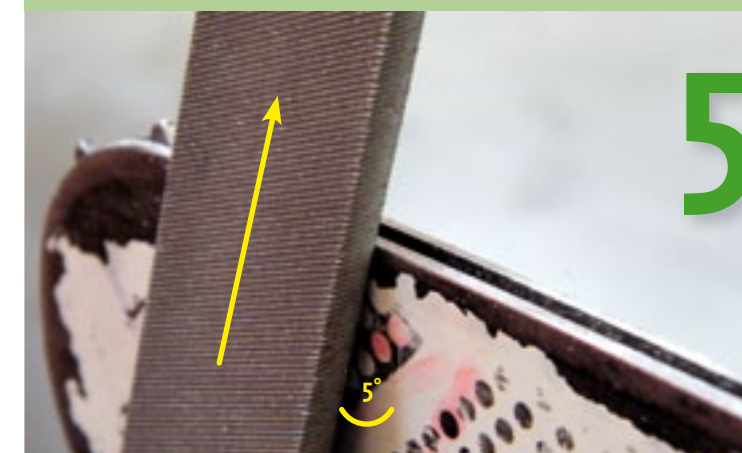
Achterste braam omhoogduwen Houd de vijl bijna vlak tegen de geleider (5°) en duw de braam omhoog. Vijl niet op één plek, vijl gelijkmatig over de hele lengte van de geleider.