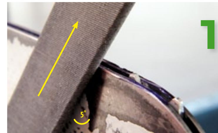
Braam omhoog duwen Gebruik een grote zoetvijl. Houd de vijl bijna vlak tegen de geleider (5°) en duw de braam omhoog. Vijl niet op één plek, vijl gelijkmatig over de hele lengte van de geleider.