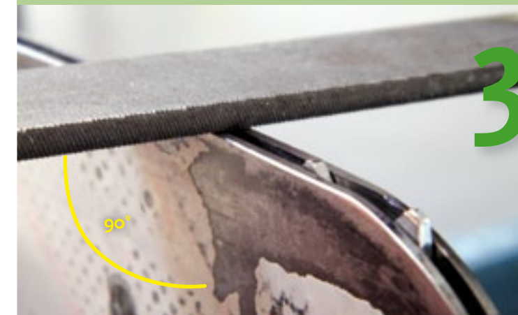
Loopvlak vijlen onder 90° Het loopvlak is ter hoogte van de stelschroefgaten en net voor het tandwiel hol uitgesleten. Houd de vijl onder een hoek van 90° en vijl tot het loopvlak weer vlak is. Tip: kleur het loopvlak met een donkere viltstift, dan ziet u de holtes duidelijk.